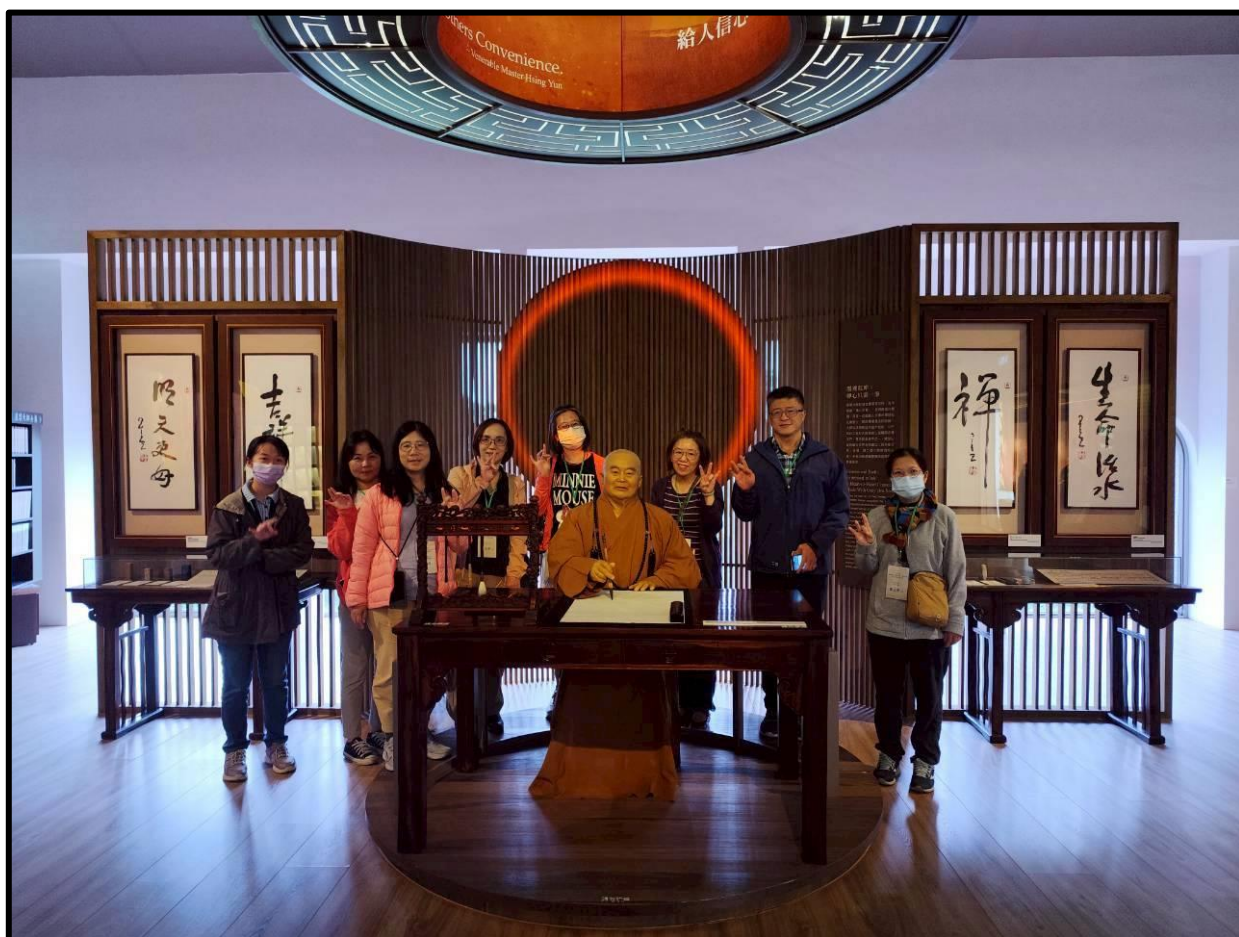
參觀開山堂及校史館，並與大師合照