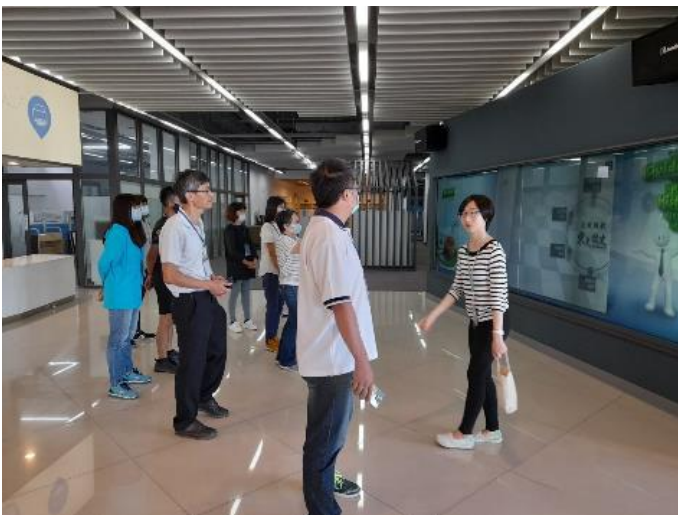
圖五、館員帶領各地的圖書館同道參觀館內設施

中午休息時間安排圖資館以及「記憶潮聲-黃貴潮 Lifok 文物特展」導覽，本次「記憶潮聲特展」展出內容包含「黃貴潮手稿及文物數位整理專案計畫」中數位化及詮釋資料(Metadata)建置完整度較高的日記手稿、照片、口簧琴，Lifok 個人文件與物件之收藏精選，以及影音資料，讓來賓們認識這位熱愛自身文化且樂於分享的阿美族長者。