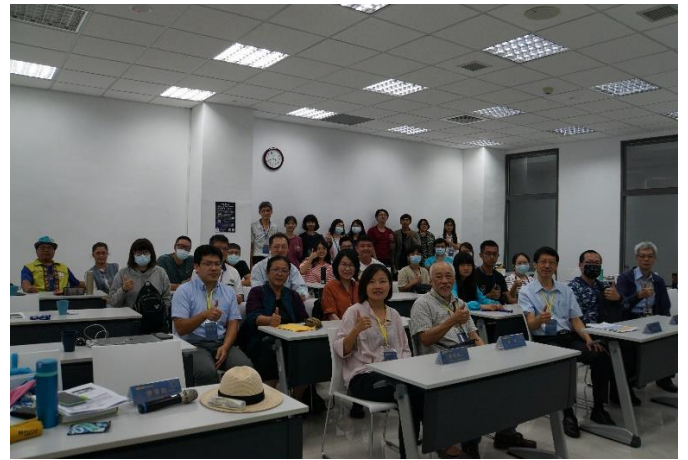
圖十二、全體參與人員大合照

本次活動以「特藏數位化」為主題，期望館際間能相互學習，深刻體認特藏數位化不僅有助於辦理展覽、出版、典藏、教學、研究等工作，期盼未來更能以數位化素材促進加值應用與創意開發，創造教育與發展知識經濟的效益。