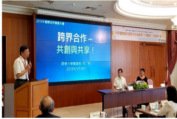
圖 15 與談人：國立屏東大學圖書館刑厂民館長