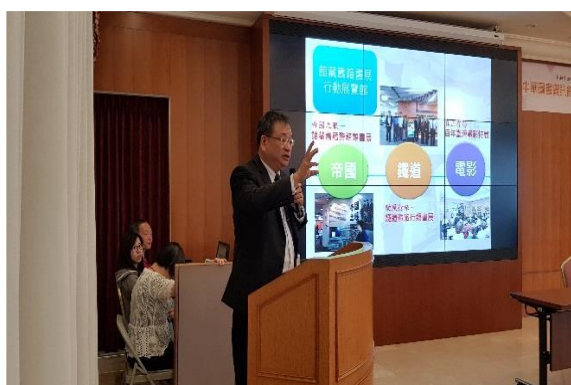
圖 19 與談人：國立臺灣圖書館鄭來長館長

大會的尾聲，為每年精心安排的摸彩活動。除了淡江大學圖書館精挑細選的六十樣禮品之外，理事長也提供了兩項大獎，讓同道期待不已，摸彩活動除了增添大會之趣味性外，也慰勞了同道們平日工作的辛勞。