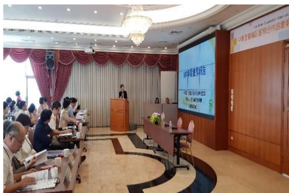
圖 9 會務報告