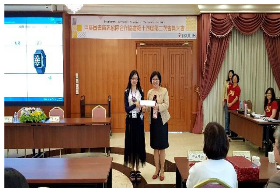
圖 21 摸彩活動授獎

經過一整天豐富且充實的各項活動，相信與會的同道皆有滿滿的收穫，咱們明年於國立臺灣圖書館見！