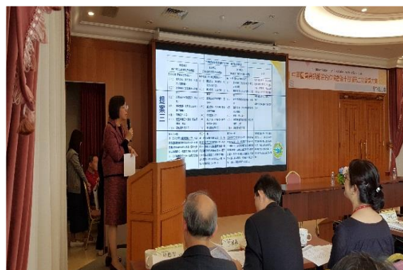
圖 10 提案討論暨臨時動議

中午用餐過後，淡江圖書館同仁帶著與會同道參觀該校總圖書館，藉由導覽人員的細心導覽解說，感受到館舍各空間獨特且貼心的設計，在參訪的過程中，彼此間也能有更多的交流及創意發想。