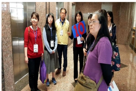
圖 11 參觀導覽