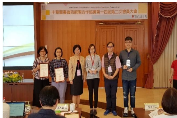
圖 8 大會頒獎